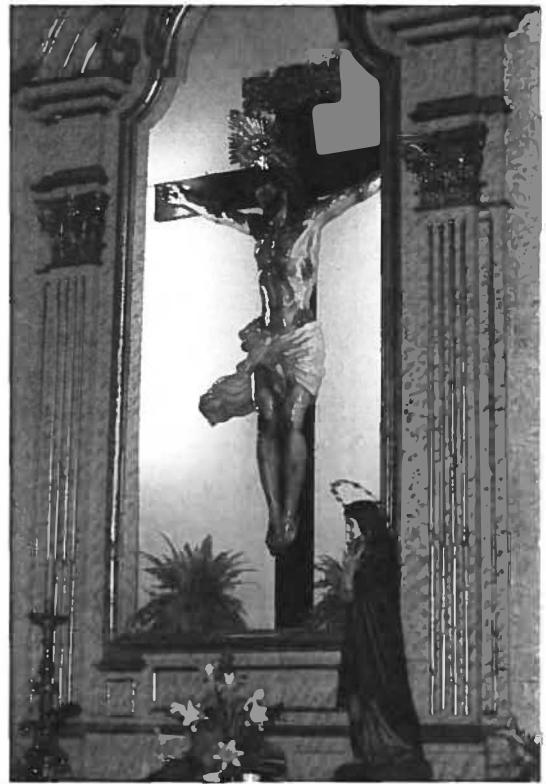
Fig. 8 Jesus Cristo Crucificado (1758). José de Almeida (escultor). Capela da Venerável Ordem Terceira do Carmo.