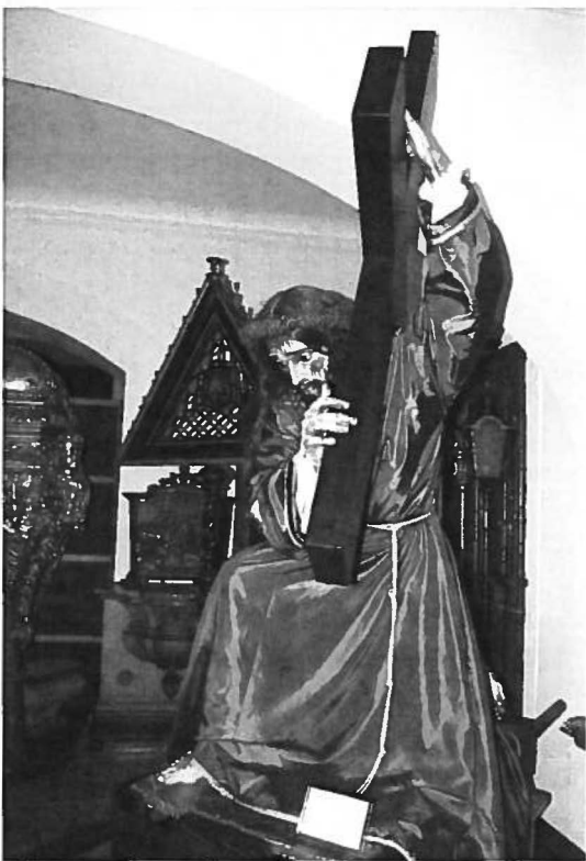
Fig. 7 Senhor dos Passos (1758). José de Almeida (escultor). Capela da Venerável Ordem Terceira do Carmo.