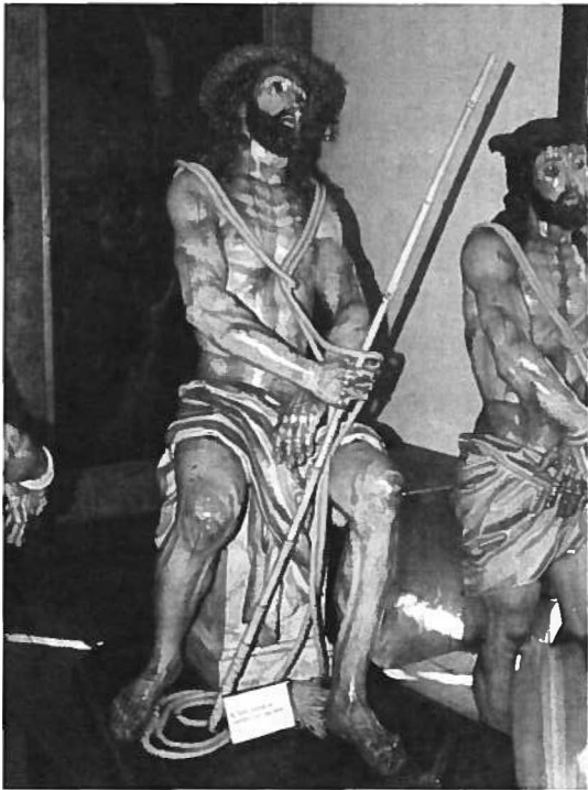
Fig. 5 Jesus Cristo sentado na Pedra Fria ou da Cana Verde (1758). José de Almeida (escultor). Capela da Venerável Ordem Terceira do Carmo.