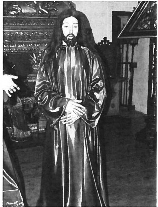
Fig. 6 Ecce Homo (1758). José de Almeida (escultor). Capela da Venerável Ordem Terceira do Carmo.