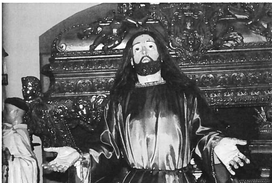
Fig. 2 Jesus Cristo orando no Horto (1758). José de Almeida (escultor). Capela da Venerável Ordem Terceira do Carmo.