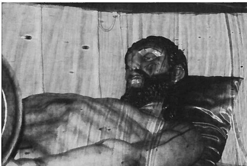
Fig. 9 Cristo Morto . Século XVIII (?). Capela da Venerável Ordem Terceira do Carmo.

de Março, 08 de Maio, 25 de Julho, 05 de Setembro, 19 de Outubro, 19 de Novembro de 1759 e ainda de 08 e 25 de Janeiro, 12 de Fevereiro e 22 de Março de 1760 – assinalando este último a altura em que deve ter concluído a elaboração das esculturas na sua totalidade (ou o seu pagamento?).