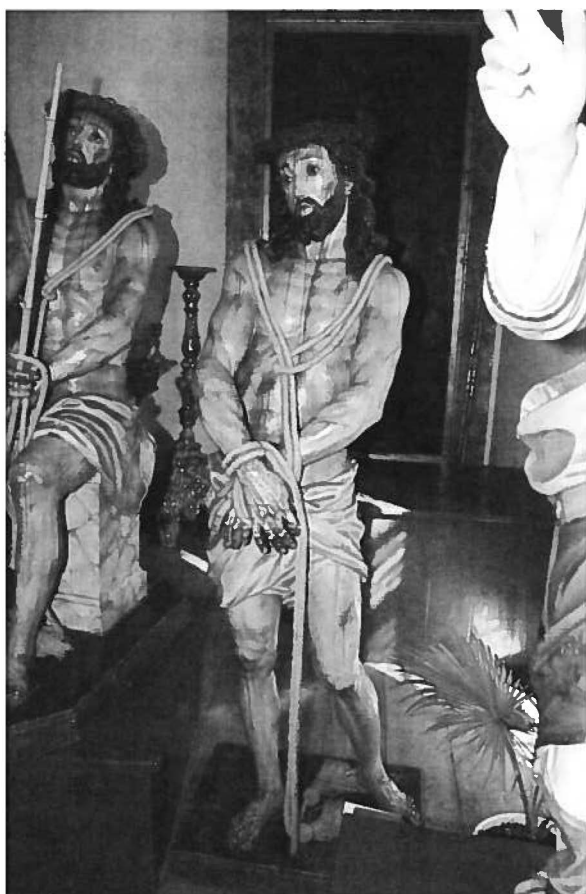
Fig. 3 Jesus Cristo Preso (1758). José de Almeida (escultor). Capela da Venerável Ordem Terceira do Carmo.