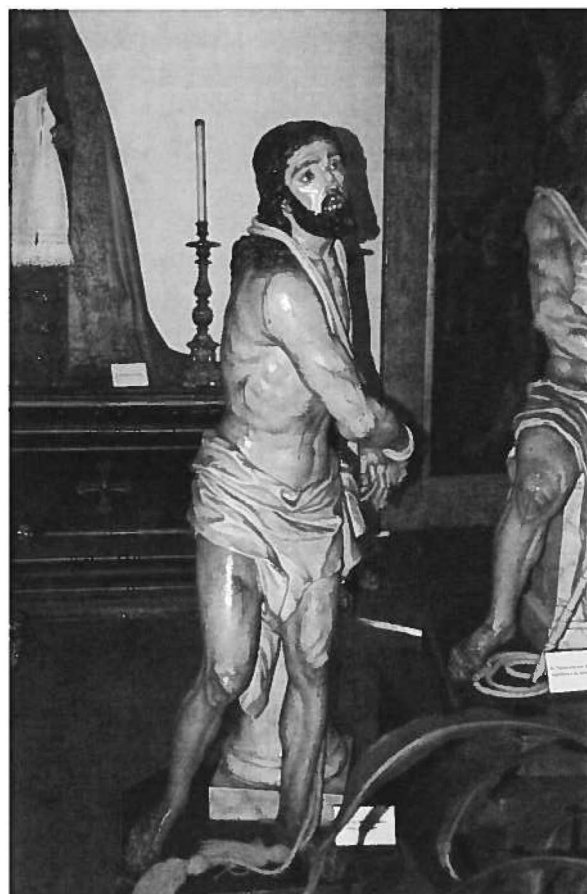
Fig. 4 Jesus Cristo atado à Coluna (1758). José de Almeida (escultor). Capela da Venerável Ordem Terceira do Carmo.