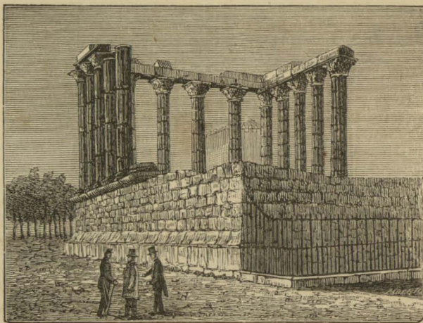
O templo romano

o rei das nobres energias e das lugubres tragedias, teve encerrado o duque de Bragança, Fernando II; do outro lado um paredão pesado e monotono, de construcção relativamente recente, forma uma face inteira do antigo edificio da inquisição; ao sul o paço dos arcebispos, as grandes linhas severas e nobilissimas da velha sé eborense, a mais completa cathedral que temos no paiz; junto