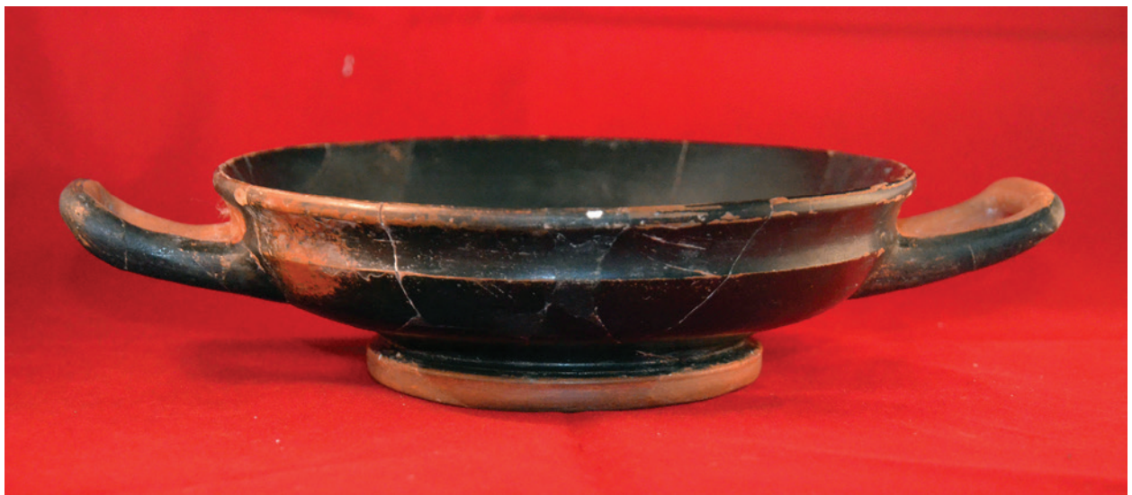
Figura 3 – Taça de Bordo convexo de verniz negro proveniente do arqueossítio de Cabeço da Azougada (AZO).