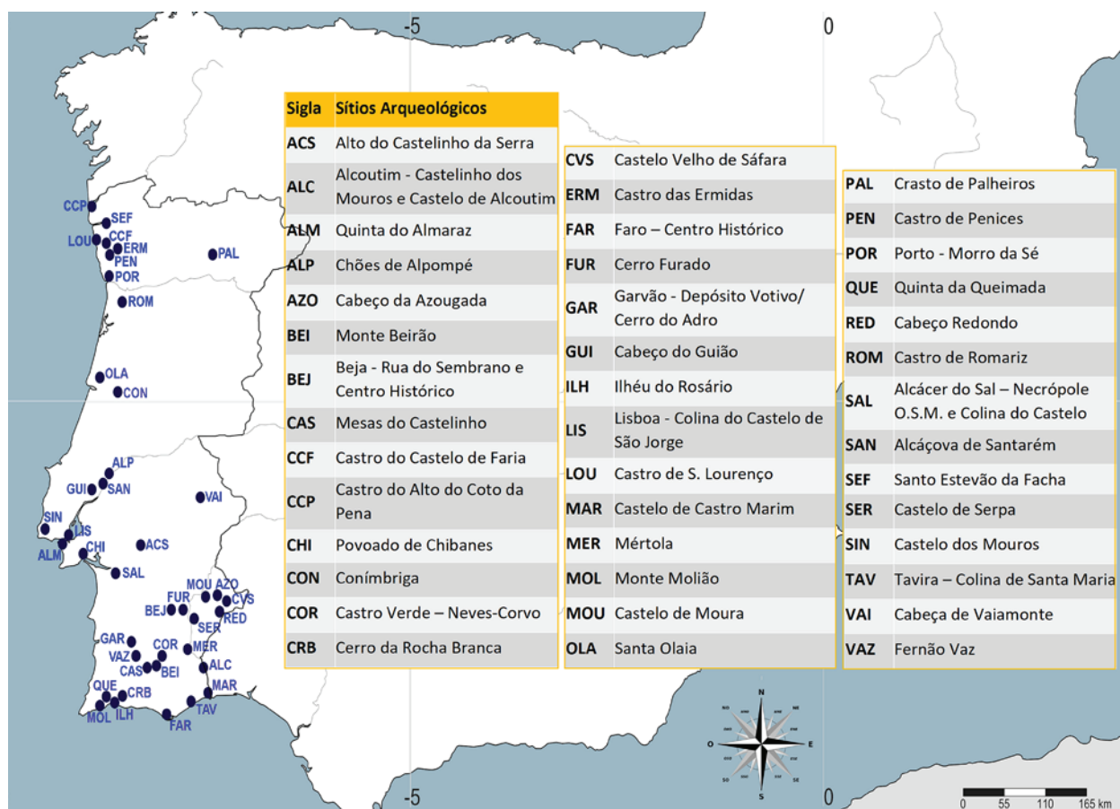
Figura 1 – Mapa com distribuição dos sítios arqueológicos onde foram identificados exemplares de cerâmica grega.

VILAÇA, Raquel (2003) – Acerca da existência de ponderaisem contextos do Bronze Final / Ferro Inicial noterrítório português. O Arqueólogo Português . Lisboa. Série IV, XXI, pp. 245-288.