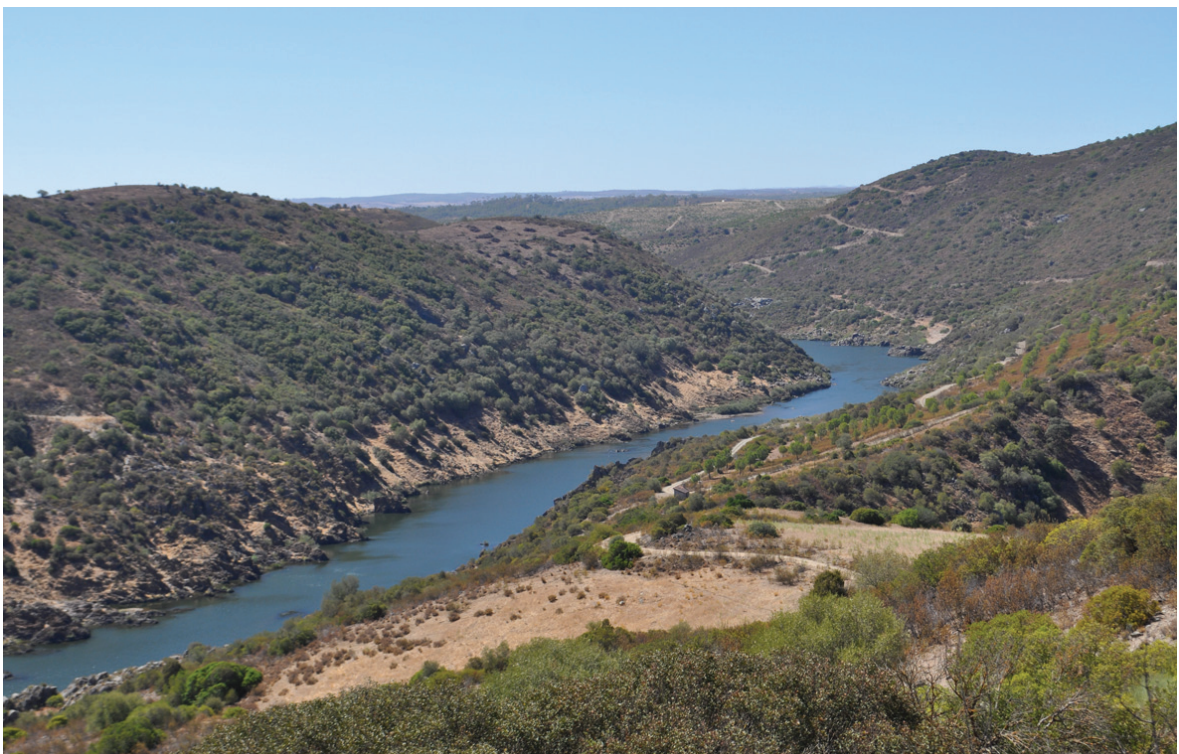
Figura 3 – Vista do Guadiana a partir de Água Alta, para Sul.