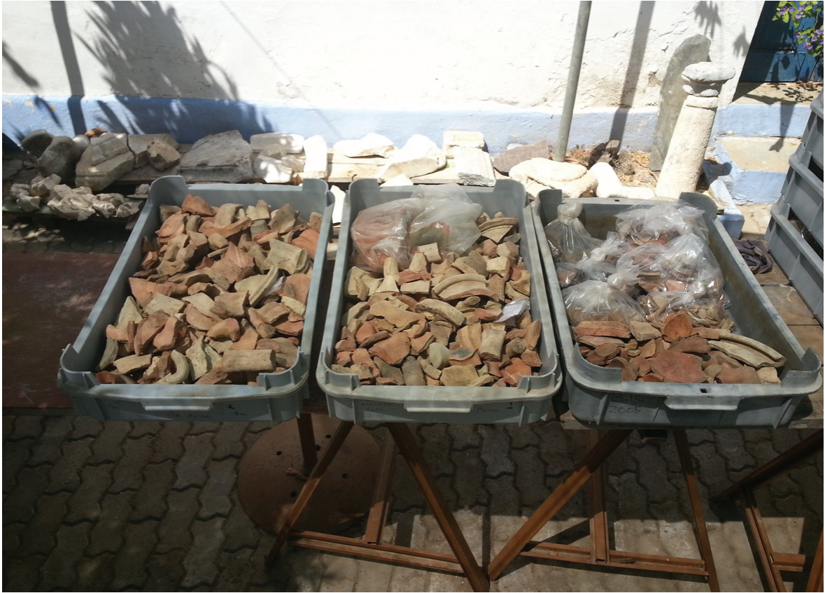
Figura 2 – Processamento de materiais nas instalações do Museu de Mértola.