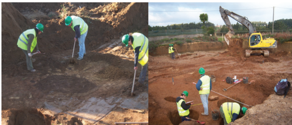
Figura 1 – MP-AZR05.08-09: a) limpeza de plano de corte de obra.; b) recolha de espólio e registos.

https://www.parlamento.pt/ActividadeParlamentar/Paginas/DetalleIniciativa.aspx?BID=5958 .